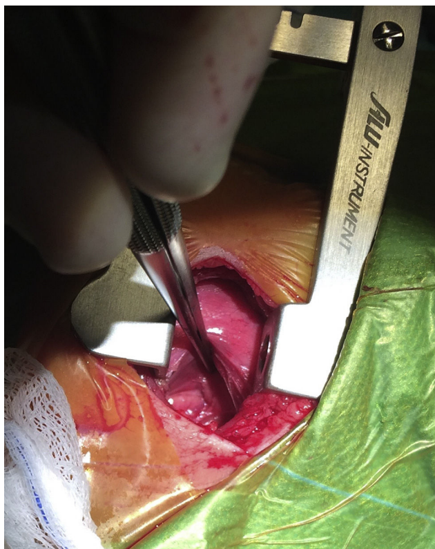
Figura 2 Abordaje extrapleural en la cirugía del ductus arterioso persistente. Nótese como el pulmón izquierdo está retraído con la pinza. La pleura visceral se encuentra íntegra y ha sido separada mediante disección roma de la pared torácica. La aorta descendente se puede observar en el fondo de la imagen.

Un tamaño muestral de 50 pacientes (30 en el grupo TP y 20 en el grupo EP) permitiría detectar como significativa una diferencia de un 50 a un 15% en la incidencia de complicaciones postoperatorias (variable resultado combinado), con una potencia de 80% y un intervalo de confianza de 95%.